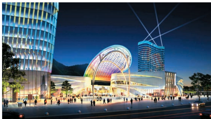
高铁新城灯光效果图

据了解,高铁新城灯光项目设计、采购、施工时间跨度大,面临的环境和情况多变,需要的配合工作纷繁复杂,加之项目本身需要结合实际持续深化完善,因此整个工程深化设计和施工都面临巨大考验。但恩倍思科技公司仍秉承着对灯光